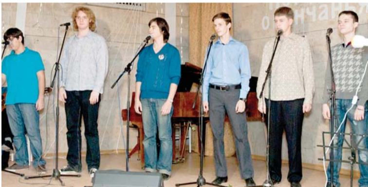
Ансамбль юношей НИЯУ МИФИ.

В новом году КСП МИФИ будут проводиться еженедельные песнопения с разучиванием бардовской классики, а также песен, написанных в свое время мифистами. В нашей газете мы предполагаем печатать наиболее интересные песни, а на сайте НИЯУ МИФИ размещать фонограммы с исполнением этих песен.