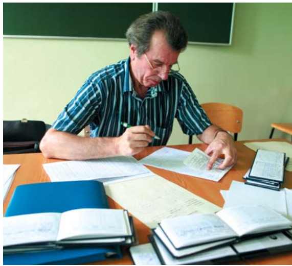
На снимках: идут экзамены на факультетах «К» и «Т».