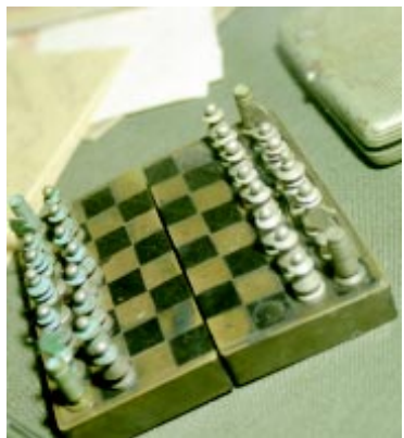
А вот в эти шахматы, сделанные бойцами из пуль, играли они в перерывах между боями.